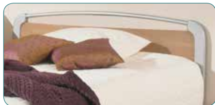
Auzence II, modernes Design, verfügbar in 140 und 160 cm