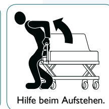
Hilfe beim Aufstehen.