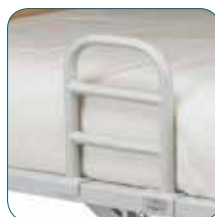
Stützgriff (erhältlich als Zubehör).