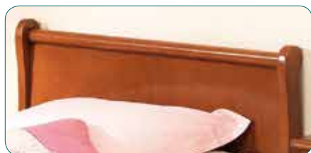
Louis-Philippe, klassisch und beruhigend, verfügbar in 140 und 160 cm