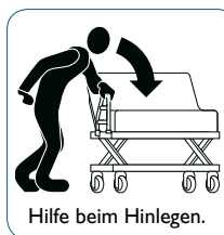
Hilfe beim Hinlegen.