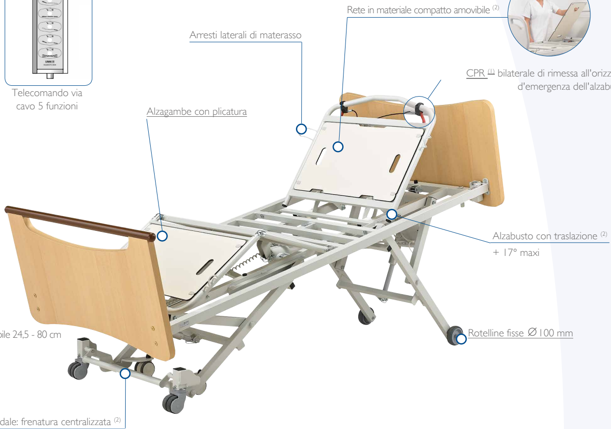
Altezza variabile 24,5 - 80 cm