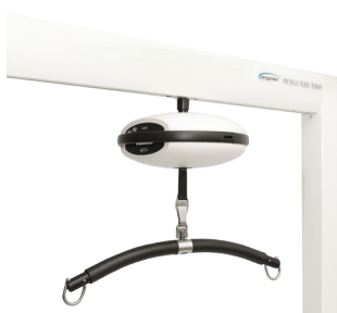
Podnośnik podwieszany Luna zamontowany na ramie Mobile Flex