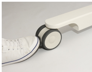
Podwójne koła z hamulcem. Łatwe zablokowanie poprzez lekkie naciśnięcie pedału hamulca