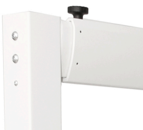
Łatwa regulacja bez użycia narzędzi