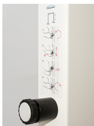
Łatwa regulacja wysokości (mechanizm sprężyny gazowej) Przyjazna, krótka instrukcja regulacji umieszczona na ramie.